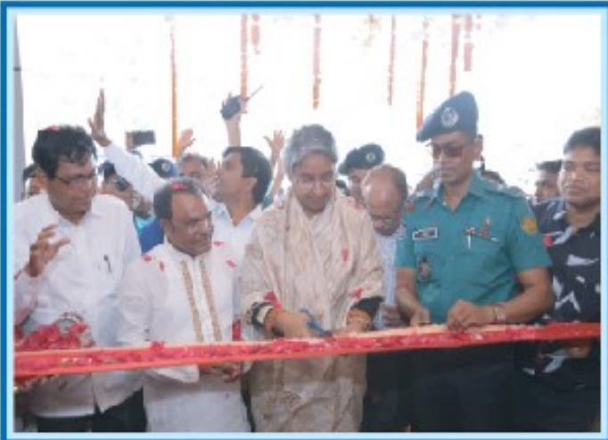
০৭ এপ্রিল, ২০১৯ তারিখে দৃষ্টিনন্দন নিজস্ব ভবনের শুভ উদ্বোধন করেন গণপ্রজাতন্ত্রী বাংলাদেশ সরকারের মাননীয় শিক্ষামন্ত্রী ডা. দীপু মনি, এমপি।

সুবিশাল এই নিজস্ব ক্যাম্পাসে মনোমুগ্ধকর, পরিচ্ছন্ন পরিবেশে শিক্ষার্থীদের নিরাপত্তাসহ নিশ্চিত করা হয়েছে আধুনিক গুণগত শিক্ষার জন্য প্রয়োজনীয় যাবতীয় সুযোগ-সুবিধা। রয়েছে সুপরিচ্ছন্নিত ও সুসজ্জিত শ্রেণিকক্ষ, বিষয়ভিত্তিক পৃথক বিজ্ঞানাগার, ৭০ টি কম্পিউটারসহ সমৃদ্ধ ও অত্যাধুনিক সুবিশাল কম্পিউটার ল্যাব, সমৃদ্ধ লাইব্রেরি, মাল্টিমিডিয়া প্রজেক্টর, লিফট, সিসি ক্যামেরা, নিরবচ্ছিন্ন বিদ্যুৎ সরবরাহ ও পরিবহন ব্যবস্থা। শিক্ষার্থী সংখ্যা বৃদ্ধির প্রেক্ষিতে বর্তমান ভবন সংলগ্ন আরেকটি নান্দনিক স্থাপত্যশৈলীর বহুতল ভবন নির্মাণ করা হয়েছে। সম্পূর্ণভাবে পৃথক ব্যবস্থাপনায় প্রভাতি ও দিবা শাখায় ছাত্র ও ছাত্রীদের ক্লাসের ব্যবস্থা রয়েছে। সর্বমোট ৩ টি বিভাগে ১৫টি বিষয়ের ১২০ জন সুদক্ষ ও অভিজ্ঞ শিক্ষক রয়েছেন যাদের আন্তরিকতা, একনিষ্ঠ পাঠদান ও নিরলস তত্ত্বাবধানে আপনার সন্তানের সুশিক্ষা সুনিশ্চিত করা হয়। বিগত ২০২১-২২ শিক্ষাবর্ষ হতে একাদশ শ্রেণিতে বিজ্ঞান বিভাগে ইংলিশ ভার্সন চালু করা হয়।